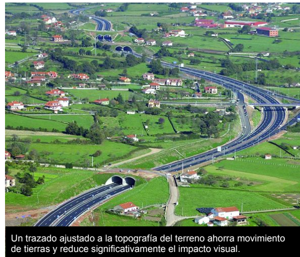
Un trazado ajustado a la topografía del terreno ahorra movimiento de tierras y reduce significativamente el impacto visual.

- Paisajismo y patrimonio cultural. La carretera nos permite viajar y disfrutar de nuestro patrimonio, uno de los más ricos de Europa, los poderes públicos tienen la obligación de cuidarlo, extremando el control durante el diseño para que la vía tenga en cuenta la calidad del entorno, integrando la obra en el mismo utilizando especies locales para la revegetación, haciendo que se cumplan las medidas correctoras de forma que el medio pueda recuperarse en el menor espacio de tiempo posible y deseable.