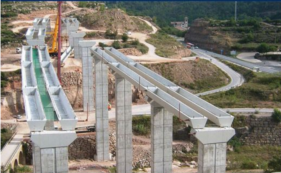
Foto del mes: Construcción del viaducto de la riera de Clarà del Eje del Llobregat