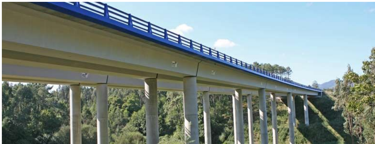
El tratamiento y restauración de las áreas afectadas, permite la rápida regeneración de la herida producida por la obra.

Resumen del artículo publicado por FCC Construcción en la Revista Carreteras.