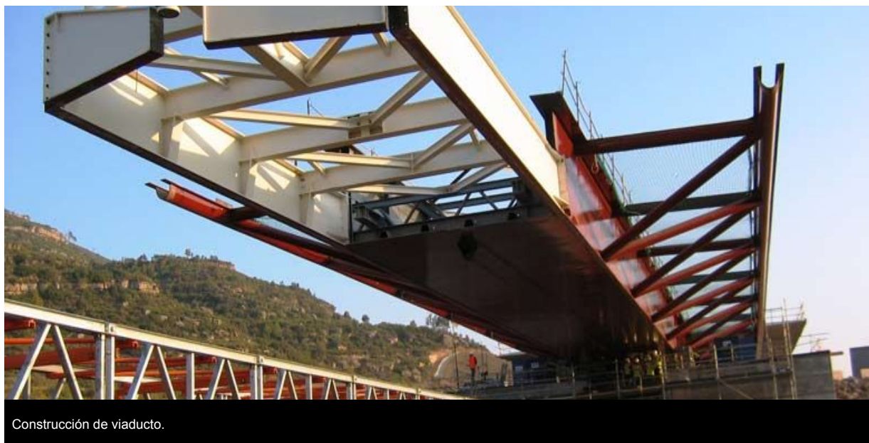
Construcción de viaducto.