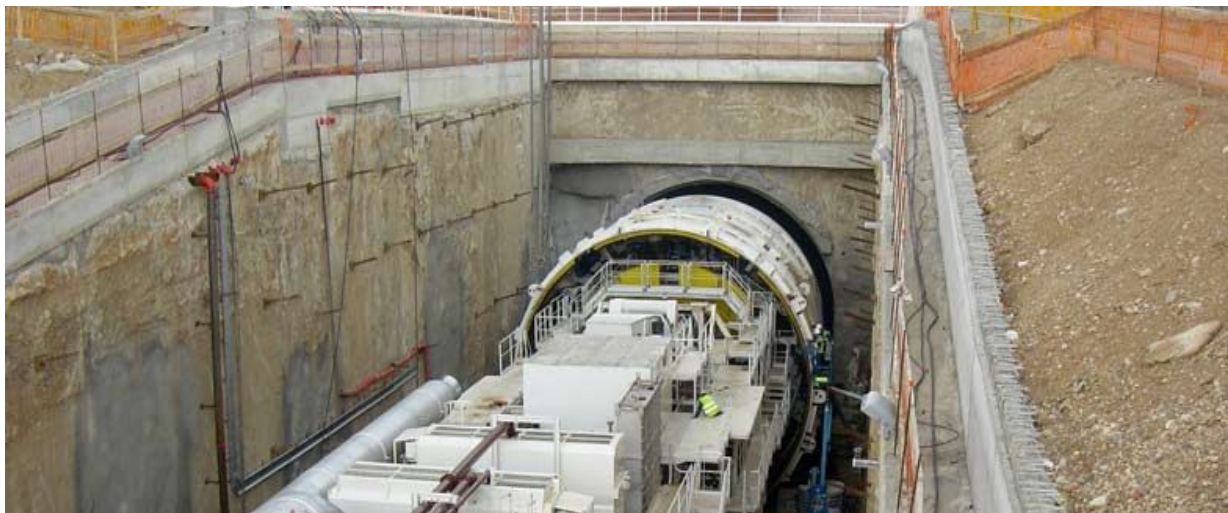
Obras de la Línea 9 del metro de Barcelona.